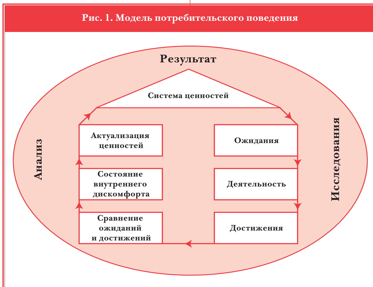
Рис. 1. Модель потребительского поведения

Этот принцип используется в ряде других подходов к изучению потребительского поведения, например, в концепции сервисного качества SERVQUAL, разработанной Паразурманом, Берри и Зейтхалмом в 1985 г. «Воспринимаемое качество воплощено в методику как разность между замерами покупательского восприятия