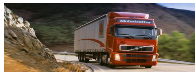
Рынок легковых и грузовых автомобилей (конкуренция транспортных средств)