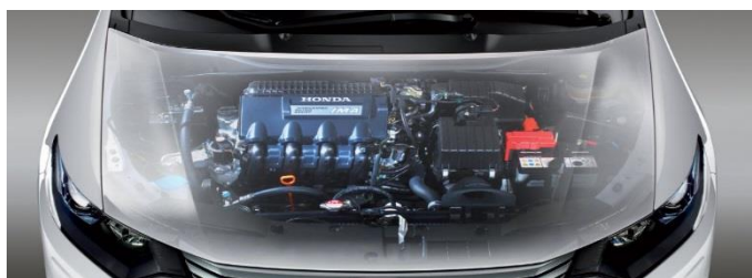
Развитие нанотехнологий (энергосбережение, энергоэффективность)