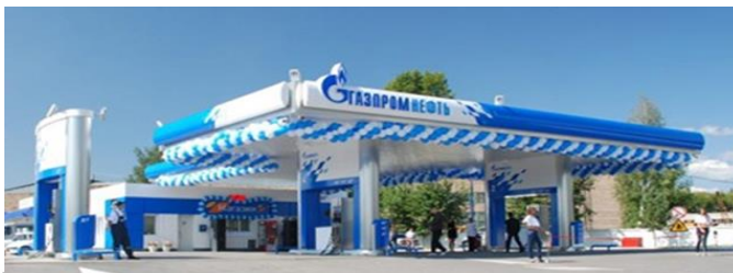
Придорожный сервис (ситуации эксплуатации автомобиля и стиль жизни)