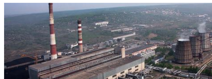
Энергетика (программа перехода с жидких и твердых топлив на газ)