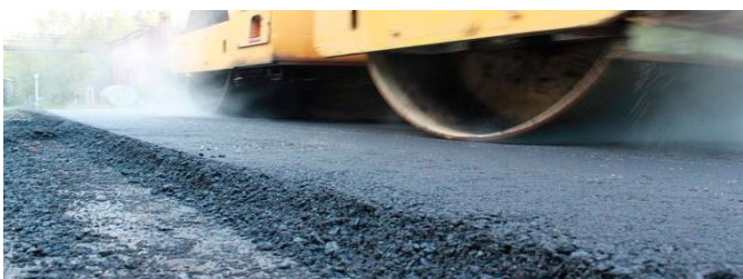
Дорожное строительство (геосинтетика, асфальтобетон)